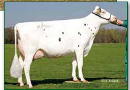
Urgroßmutter Broeks Snowman Betty VG 88