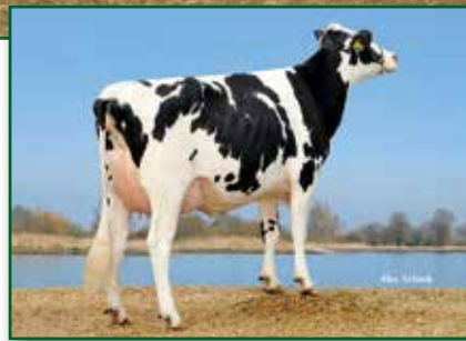
Großmutter Broeks Plabet VG 88