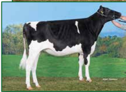
Mutter Broeks Madibet