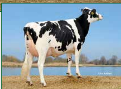
Großmutter Broeks Plabet VG 88