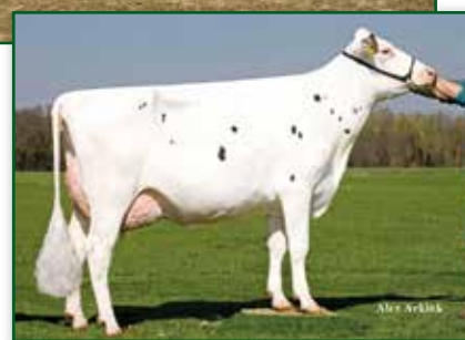
Urgroßmutter Broeks Snowman Betty VG 88