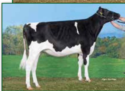
Mutter Broeks Madibet