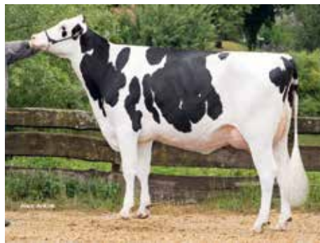
Großmutter Col Larissa VG 86