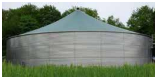
Gülesilos, Gülletechnik, Separatoren