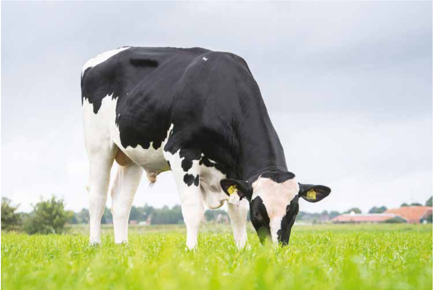
GoG Collin 159008