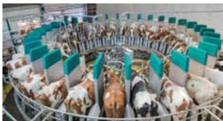
Melken, Füttern, Kühlen, Hygiene