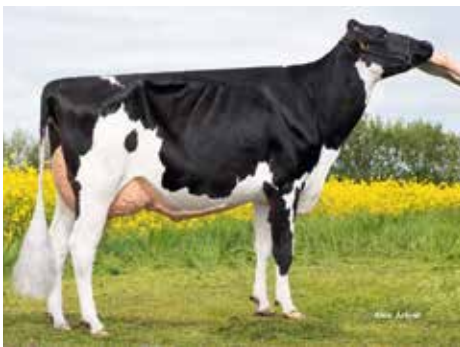
Mutter Venezia VG 86