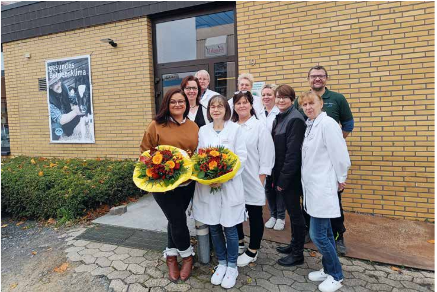
Nach 2 Tagen Labor-Begutachtung durch die DAKKS wurde die einwandfreie Arbeit beim MKV bestätigt Wir sagen Danke – dem Labor, EDV-Team und auch den TSW-Fahrern