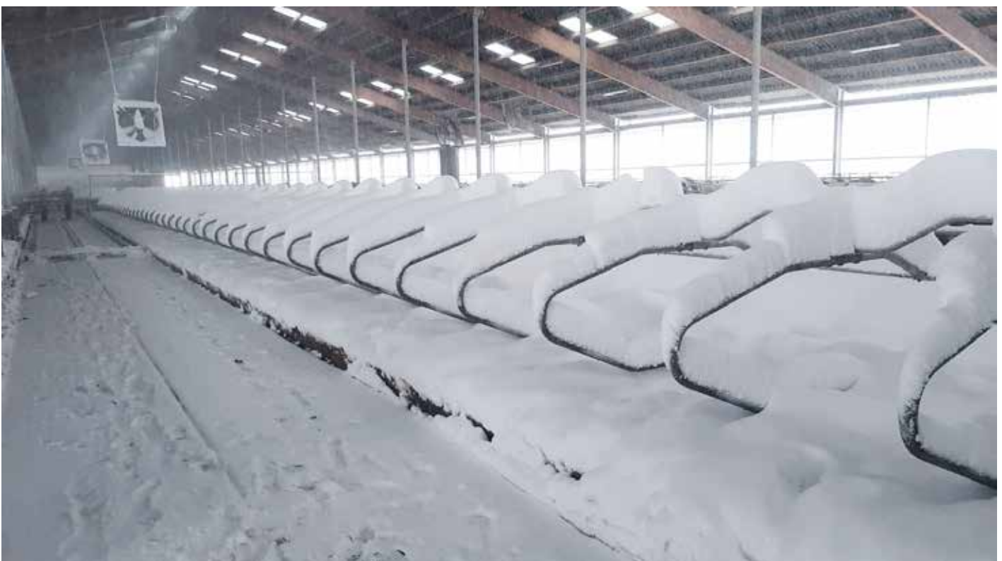
Winter in einem Betrieb im KV Rodewald