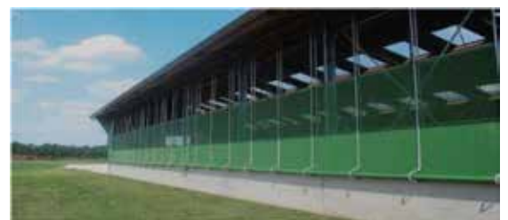
Windschutzsysteme, Rolltore, Maxitore