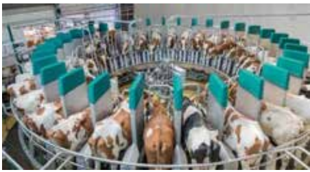
Melken, Füttern, Kühlen, Hygiene