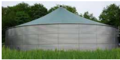
Gülesilos, Gülletechnik, Separatoren