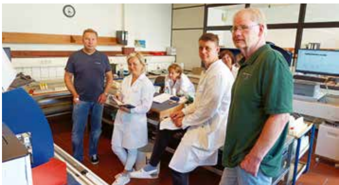
Die Labormannschaft des MKV wird eingewiesen.

Mit der neuen Technik können die Proben etwas schneller untersucht werden. Zudem sollen im Jahr 2024 die Spektraldaten, die von jeder Probe anfallen, erweitert ausgewertet werden, sodass auch Hinweise zum Stoffwechselstatus der Kühe bzw. Ketose möglich sind.