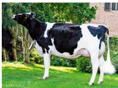
Mutter Fantasy GPlus VG 85 (1. La)